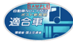
最新排出ガス 適合車

低公害車に関する情報は 九都県市 HP : http://www.9taiki.jp/