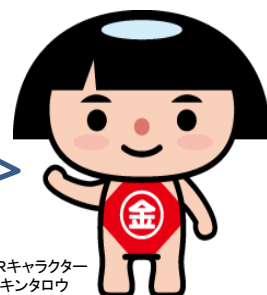
神奈川県PRキャラクター かながわキンタロウ

「大気汚染防止法」、「石綿障害予防規則」といったアスベスト（石綿）関係法令が今年6月から改正・施行され、建物所有者、施工者などの責務が厳格化されました！