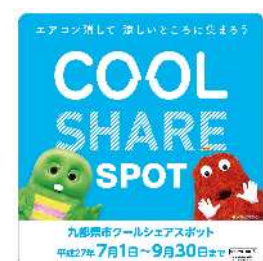
(九都県市クールシェアステッカー)