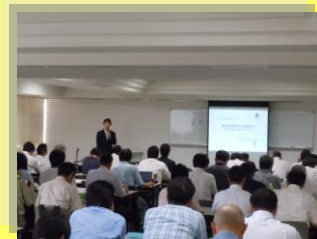
昨年度の研修風景